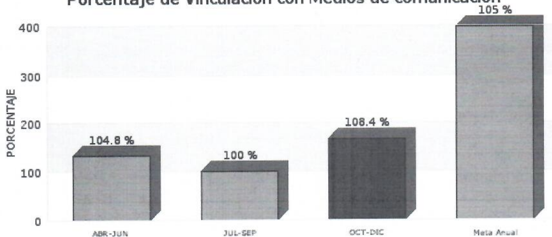
Gráfica de Indicador Porcentaje de Vinculación con Medios de comunicación